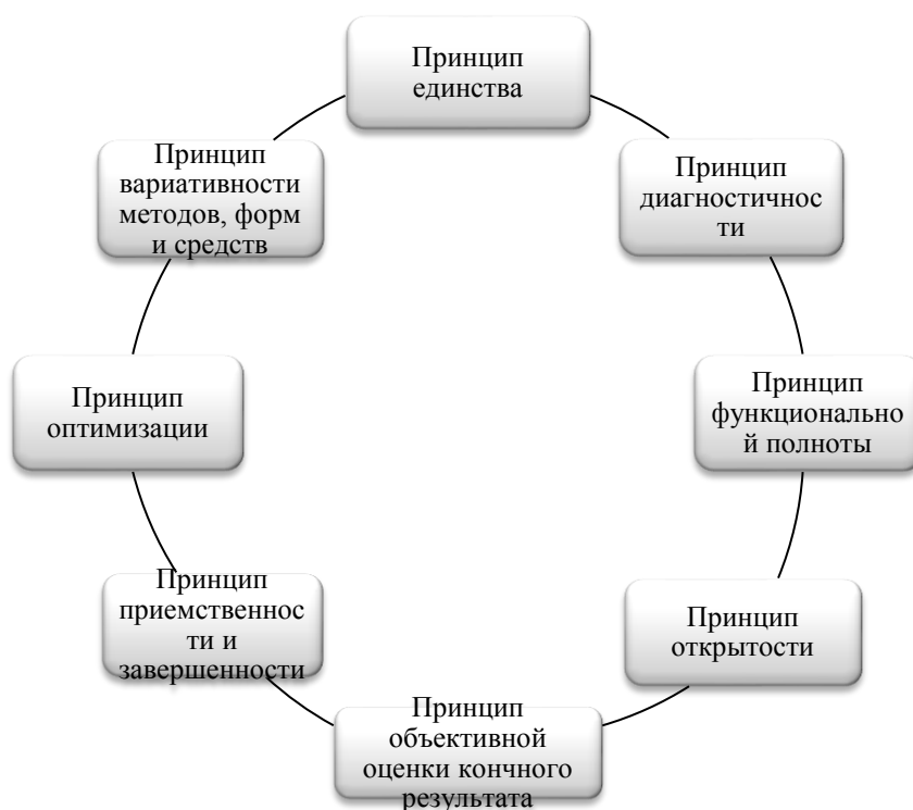
Рисунок 1 Принципы здоровьесберегающего воспитания